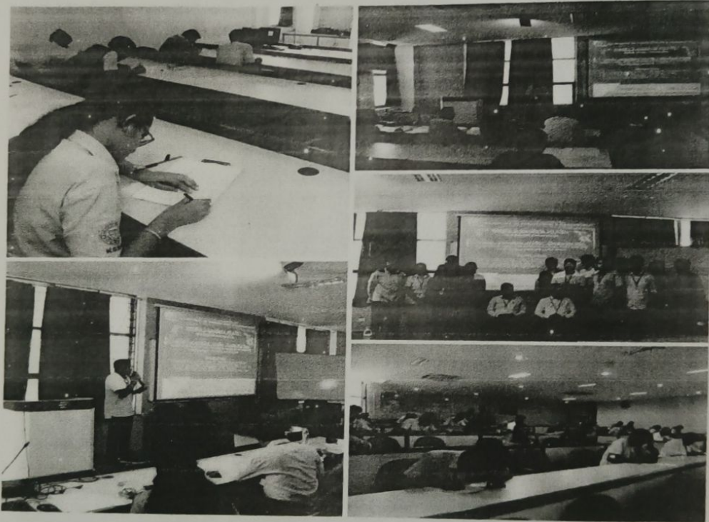
Fig 1: Glimse of the Essay Writing and Pick and Speak Event (Day 1)

Pick and Speak Competition was held from 11 am to 12:15 pm. 15 students participated in the pick and speak event, which showed the embracement of the Kannada language among students.